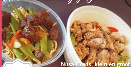
Nusa-Bowls, klein en groot

Kleine Toko BY ESSIE UIT DE MOLUKS/ INDISCHE KEUKEN